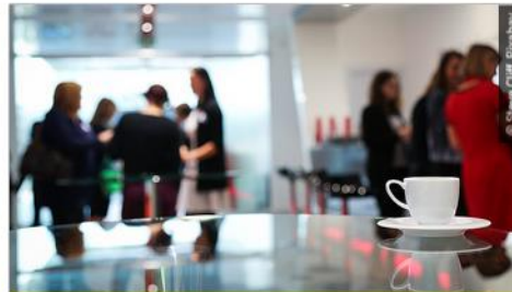
FDM-Konferenzen und Journale