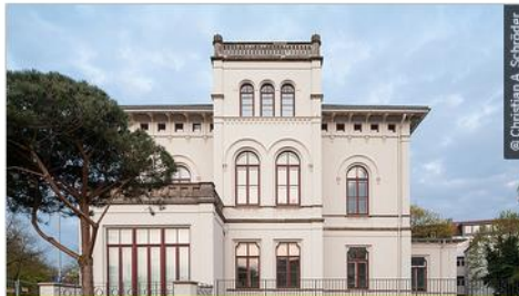
Schulungsunterlagen und weitere Materialien